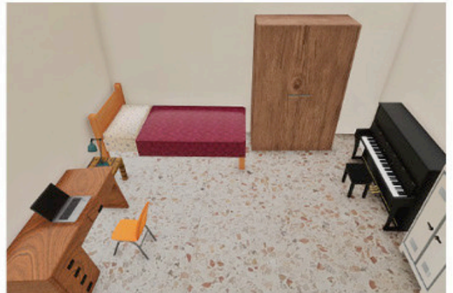
In alto Fig. 3 Esempi di ambienti virtuali utilizzati in Agnoli et al. (2021) per studiare l'influenza dell'ambiente sulla performance creativa. Nella riga in alto un ambiente in grado di favorire (a sinistra) e un ambiente in grado di ostacolare (a destra) il pensiero creativo; nella riga inferiore due contesti (reale a sinistra, replica virtuale a destra) utilizzati come ambienti di controllo.