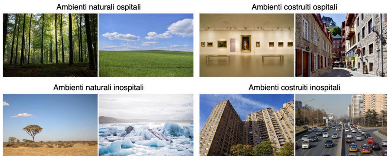
Fig. 1 Esempi di immagini di ambienti utilizzati nello studio di Stragà et al. (2023). Nella riga in alto alcuni ambienti considerati altamente ristorativi, naturali (a sinistra) e costruiti (a destra). Nella riga in basso alcuni ambienti naturali considerati meno ristorativi (a sinistra) e alcuni ambienti costruiti considerati molto poco ristorativi (a destra).