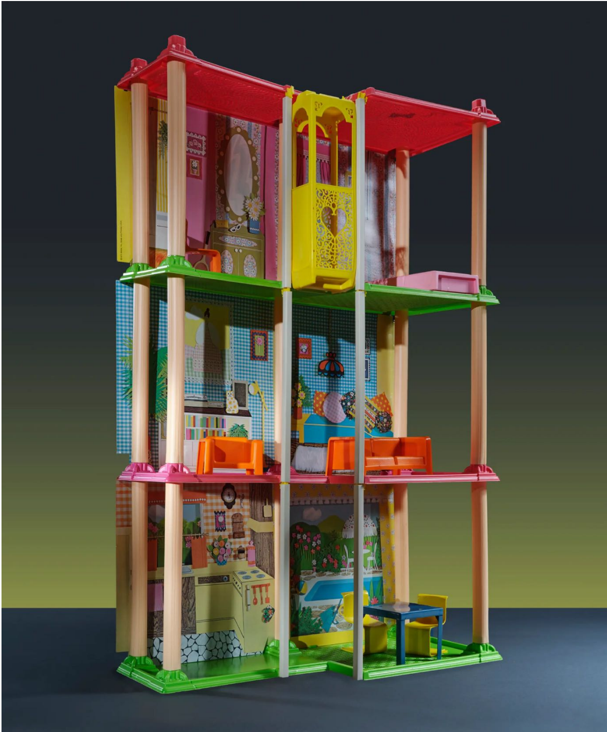
4 | La casa dei sogni di Barbie del 1974 fotografata da Evelyn Pustka per PIN-UP, 2022.

Charles Moore, il paesaggista Lawrence Halprin e la designer grafica Barbara Stauffacher Solomon.