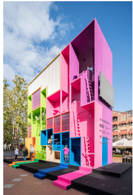
10 | MVRDV con The Why Factory, Tetris Hotel , Eindhoven, 2017.

Barbie è stata oggetto di molte critiche per l'immagine corporea distorta e irraggiungibile che le bambine rischiano di interiorizzare come forma corporea ideale. Alcune ricerche hanno osservato che le bambine più grandi tendono a mutilare e sfigurare Barbie in quello che potrebbe essere un rito di passaggio e di separazione da un giocattolo dell'infanzia, ma che può essere interpretato anche come un rifiuto del corpo di Barbie e del modello che impone (Matthewson 2002).