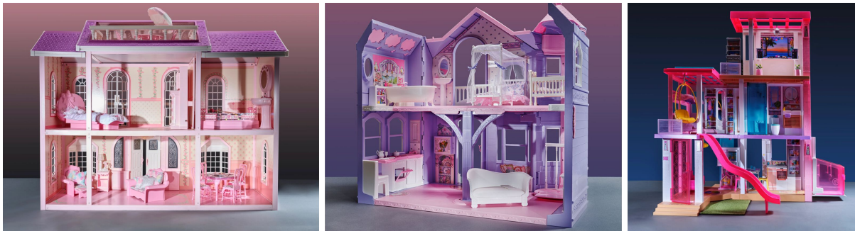
7 | La casa dei sogni di Barbie del 1990 fotografata da Evelyn Pustka per PIN-UP, 2022.