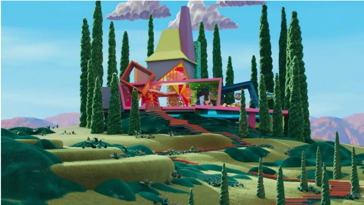
11 | La casa del personaggio Barbie Stramba nel film Barbie , Greta Gerwig, 114 min, Stati Uniti d'America, Regno Unito, 2023.

Barbie Stramba, oggetto di queste pratiche, rappresenterebbe, allora, non solo la diversità ma il rifiuto del corpo normato, l'esito di un residuo resistente della capacità teorica e critica dei bambini. Barbie Stramba costituisce allora una minaccia che motiva l'architettura perturbante che le è destinata.