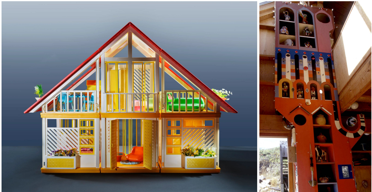
5 | La casa dei sogni di Barbie del 1979 fotografata da Evelyn Pustka per PIN-UP, 2022.