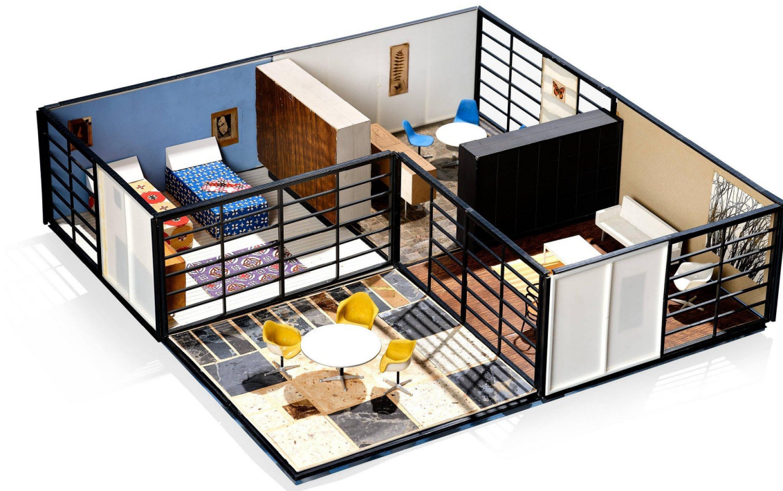
3 | Charles and Ray Eames, Revell Toy House Model, 1959.

Nella prima casa di Barbie, la cucina non c'è affatto e ai muri, invece delle forme in rame per dolci, sono appesi i gagliardetti del college. L'unico letto presente fa di questa la prima doll's house per una donna single. La casa sembra una scena teatrale o – come sottolinea Beatriz Colomina – il set di una delle serie televisive che in quegli anni cominciano ad avere come protagonista una donna single. Torna in mente anche la Villa E-1027, progettata nel 1926 da Eileen Gray, un precedente importante di casa costruita intorno alla cura e al piacere del corpo femminile e che presenta, come la prima Dreamhouse , un letto nel soggiorno. I materiali e i colori della prima Dreamhouse ricordano, soprattutto, la casa giocattolo progettata da Charles e Ray Eames per l'azienda di giocattoli Revell nel 1959, anno di nascita di Barbie. La Revell Toy House [Fig. 3], mai messa in produzione, è costituita da quattro stanze che possono essere accostate in piano o sovrapposte, introducendo, nella rigidità delle doll's house , una possibilità creativa e combinatoria, caratteristica degli altri, diversi, giocattoli progettati dagli Eames.