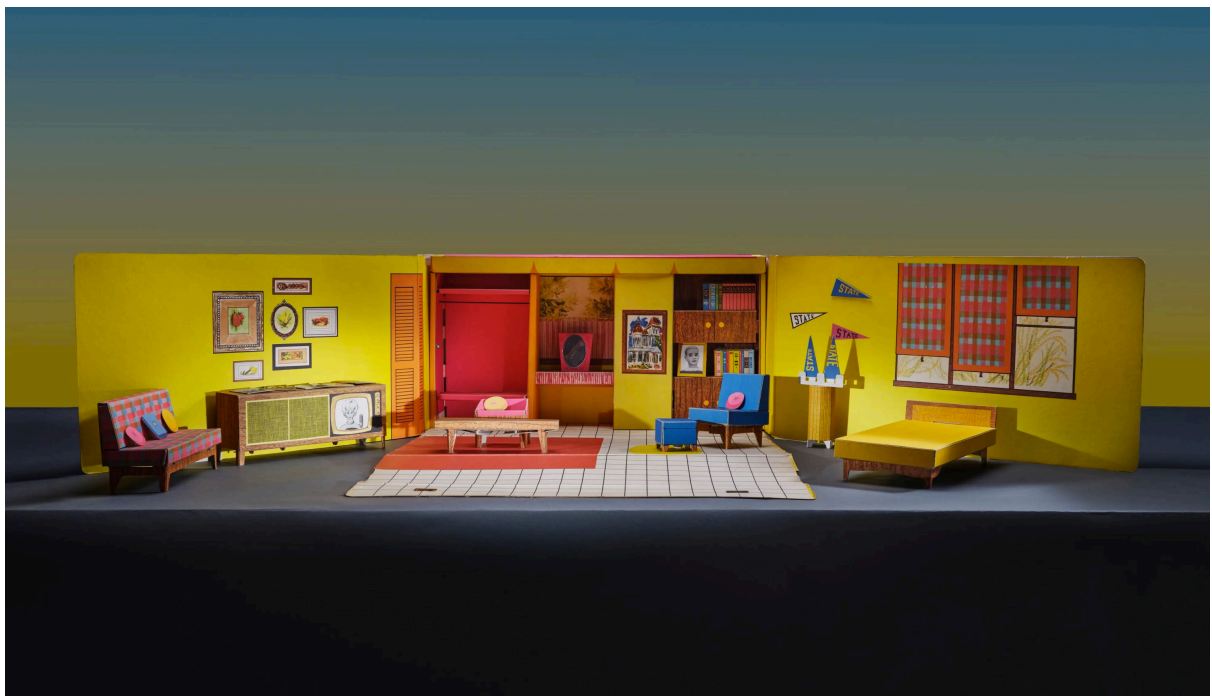
1 | La casa dei sogni di Barbie del 1962, fotografata da Evelyn Pustka per PIN-UP, 2022.