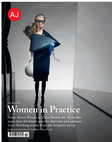
12 | Copertina di "Architect's Journal" del 12 gennaio 2012.