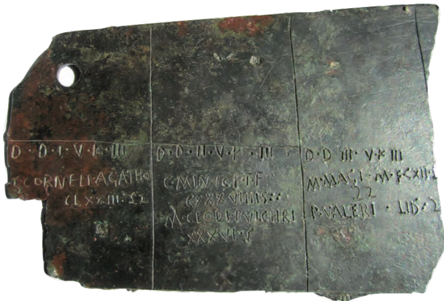
Fig. 1 Catasto A e apografo: foto tratta da Trans Padum ... usque ad Alpes. Roma tra il Po e le Alpi: dalla romanizzazione alla romanità . Atti del Convegno, Venezia 13-15 maggio 2014, a cura di G. CRESCI MARRONE, Roma 2015, Tavv. VII a e b