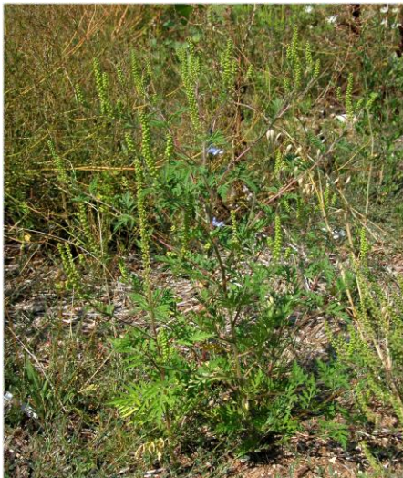
Ambrosia artemisiifolia L.

La perdita di biodiversità ha assunto un ruolo chiave negli ultimi decenni nella ricerca scientifica (Sala et al. 2000); molti studi hanno dimostrato che questi cambiamenti alterano i processi ecosistemici modificandone persino la loro capacità di riprendersi a seguito di un disturbo (resilienza). Scienziati e policy maker sono attualmente impegnati a cercare di comprendere le conseguenze che le alterazioni antropiche possono causare agli ecosistemi ed ai servizi ecosistemici ad essi correlati. Ad oggi, gli effetti dei cambiamenti climatici sulla biodiversità non sono totalmente noti dato che le scale temporali su cui agiscono questi fenomeni sono generalmente piuttosto ampie. Tuttavia, ci si aspetta che i cambiamenti climatici possano avere pesanti ripercussioni sulla biodiversità modificando fenologia, composizione genetica ed areali delle specie, alterando anche le loro interazioni biotiche ed i processi ecosistemici (Hellmann et al. 2008); è stato stimato che i cambiamenti globali attualmente in atto hanno compromesso fino