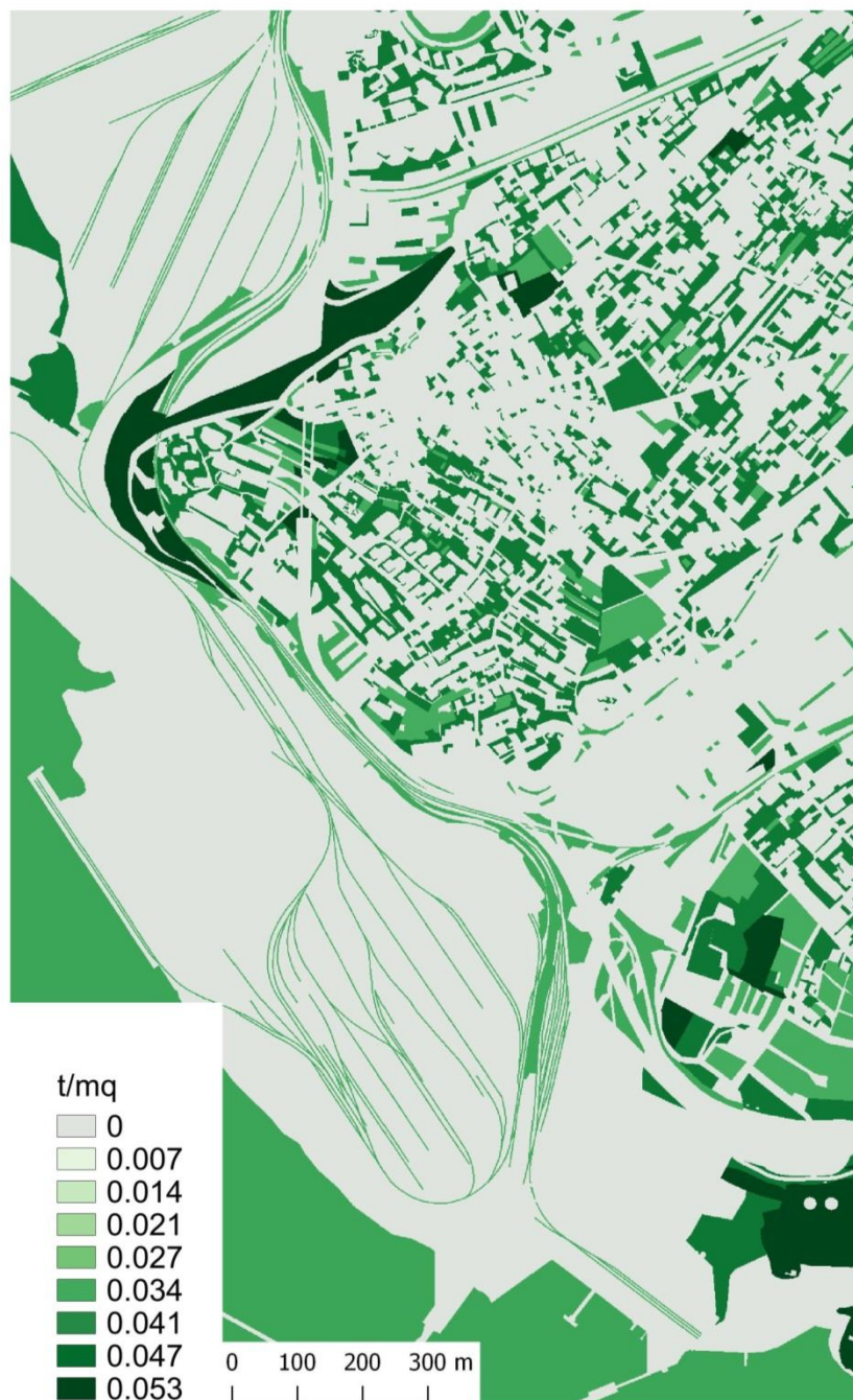
Figura 3: mappa della quantità di carbonio stoccata nell'area di studio, espresso in t/m 2 .

Lo stock attuale di carbonio totale dell'area di studio è di 33219 t per un valore economico di quasi 610000 $. Nello scenario ipotizzato (aumento del tasso di urbanizzazione del 10% entro il 2050) si osserva una perdita di carbonio totale pari a 1800 t (-23341$).