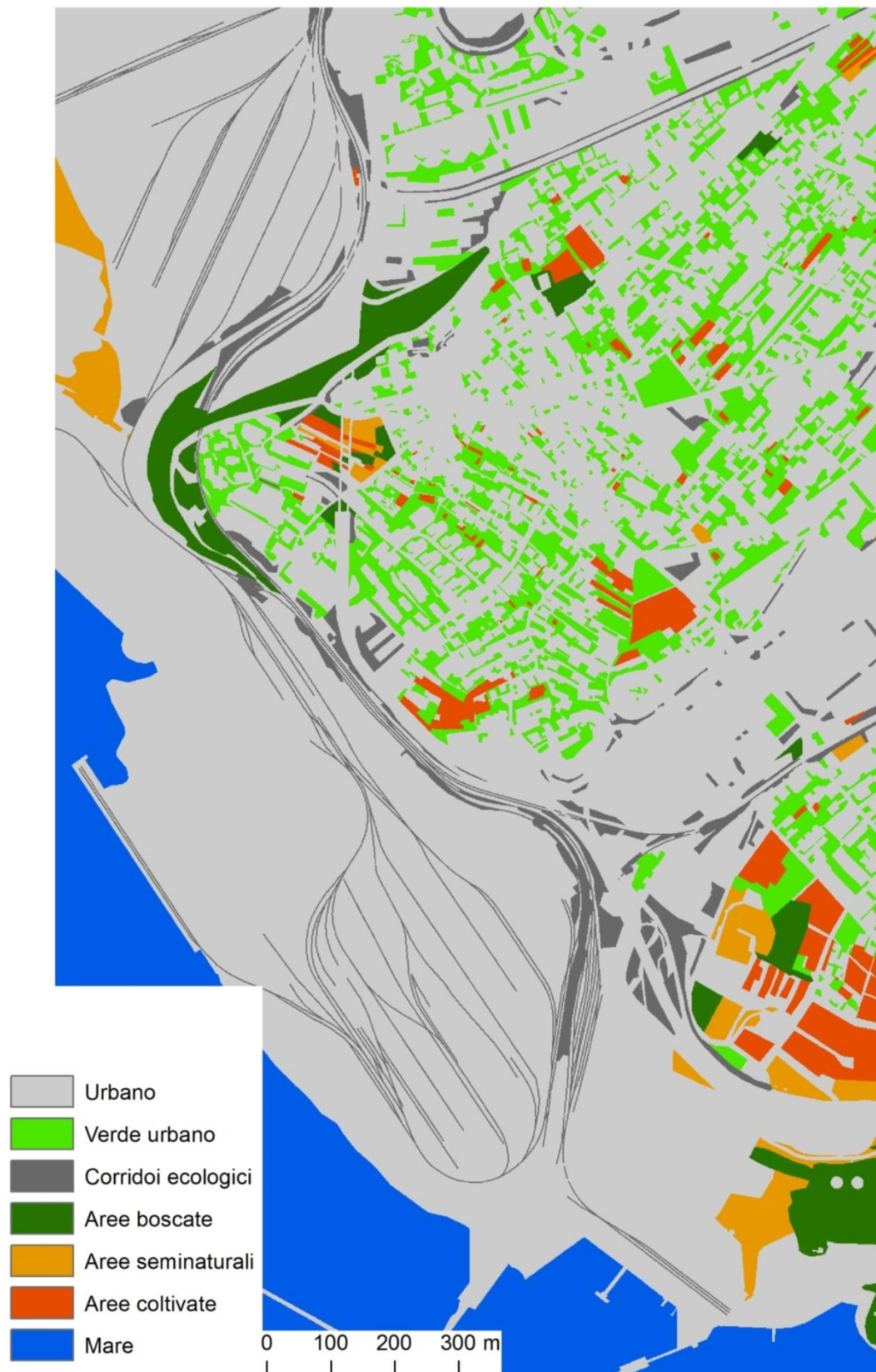
Figura 2 – classificazione dell'area di studio sulla base delle classi di uso del suolo in tabella 2