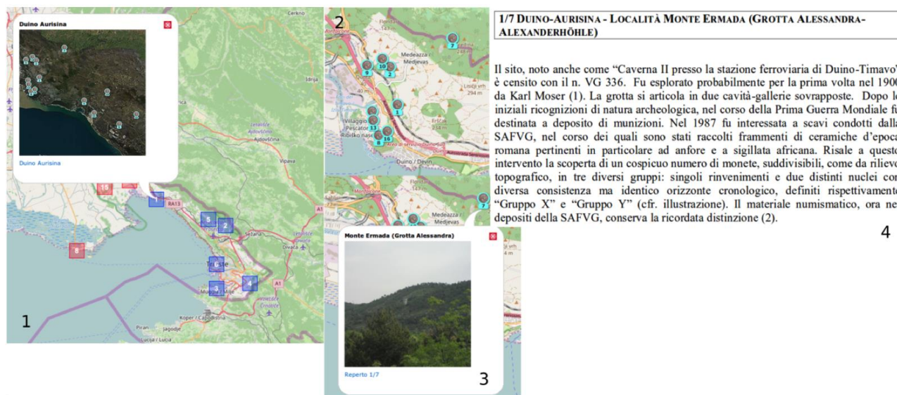
Figura 2. Esempio di una query a un reperto in provincia di Trieste. Le finestre numerate indicano la sequenza delle loro consultazioni.

della moneta numero 7. In questo caso la finestra riporta una fotografia della zona del rinvenimento (realizzata a cura di GISLab – Dipartimento di Studi Umanistici) e il collegamento al reperto qui ritrovato (“Reperto 1/7”). Infine, il riquadro 4 mostra le informazioni sul reperto sotto forma di un file in formato pdf, tratte da Callegher (Callegher, 2010).