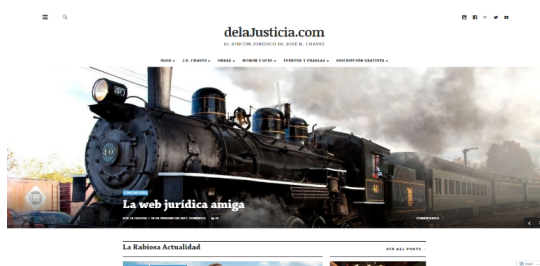
Figura 1. Página web de delaJusticia.com (Blawgs_1)