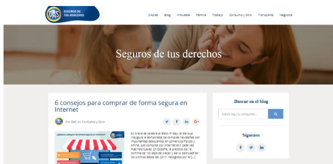
Figura 3. Página web de DAS (Blawgs_2)

La orientación hacia el ciudadano (“un despacho orientado a las personas, un despacho multidisciplinar a tu servicio o seguro de tus derechos”) es vehiculada también por las imágenes: la relación es una de las más íntimas y personales (Figuras 2 y 3), en la que los padres cuidan a sus hijos.