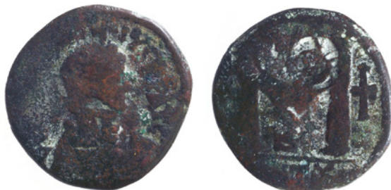
Fig. 5. Follis Anastasio con contromarca (melograno?). © Fondo Pietro Ravazzano. Museo Bottacin (Padova). Inv. 1178.