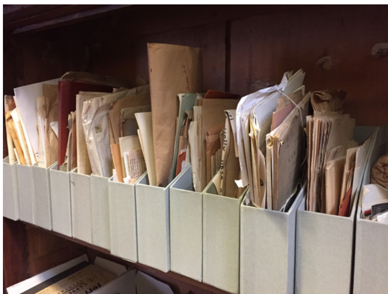
Fig. 1. Carte “bizantine” del Fondo Bertelé-Malaspina.