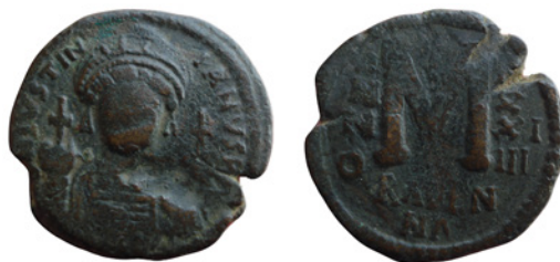
Fig. 14. Medesimo follis di Giustiniano I per Ravenna dell'anno 34 (560/61), Museo Nazionale di Ravenna, inv. 2274. Cfr. Ercolani Cocchi 1983, p. 73, n. 99.