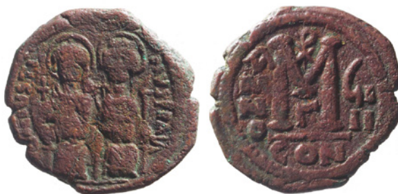
Fig. 7. Follis Giustino II. © Fondo Pietro Ravazzano. Museo Bottacin (Padova). Inv. 1388.