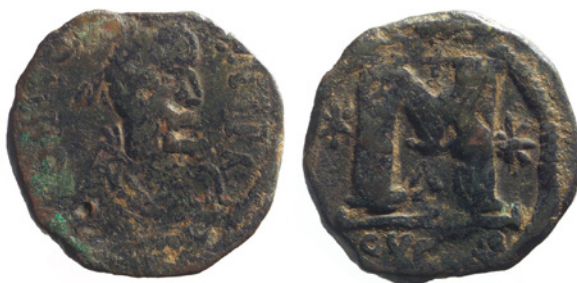
Fig. 6. Follis imitativo di Giustiniano I. © Fondo Pietro Ravazzano. Museo Bottacin (Padova). Inv. 1373.