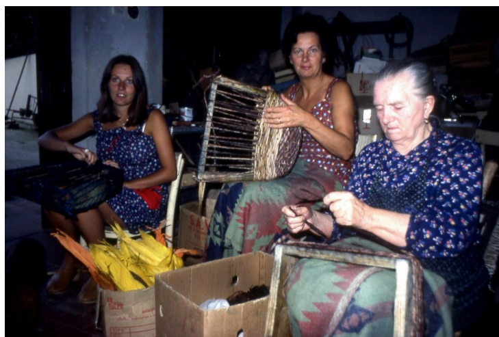
Fig. 2. Le sportare (Udine, 1978)

Tornando all'aneddoto da cui siamo partiti, chi scrive ricorda di essersi presentato alla prova finale di schedatura portando con sé un piccolo mortaio di bronzo, quasi nuovo, ottenuto usando un crogiuolo disponibile come strumento didattico in un istituto tecnico. Di fronte alla prevista reazione accigliata dell'esaminatore, il candidato si è affrettato a chiarire che quello era l'oggetto dell'esercitazione di classificazione in mancanza di meglio, nella consapevolezza che mai e poi mai si sarebbe sognato di proporre per la schedatura reale un oggetto di produzione moderna. In quella sede, infatti, si trattava di schedatura e protezione di beni culturali materiali, che devono essere quasi per definizione "antichi" o, almeno, "vecchi" per essere considerati di pregio e dunque meritevoli di considerazione. Se fosse accaduto ora, il candidato avrebbe avuto buon gioco a sostenere che quell'oggetto, proprio perché di produzione recente, ben rappresentava la perdurante vitalità di un know-how antico che si intenderebbe salvaguardare.