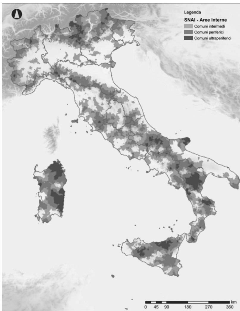
Fig. 1. La geografia dei Comuni interni: intermedi, periferici, ultra-periferici. Elaborazione su dati SNAI