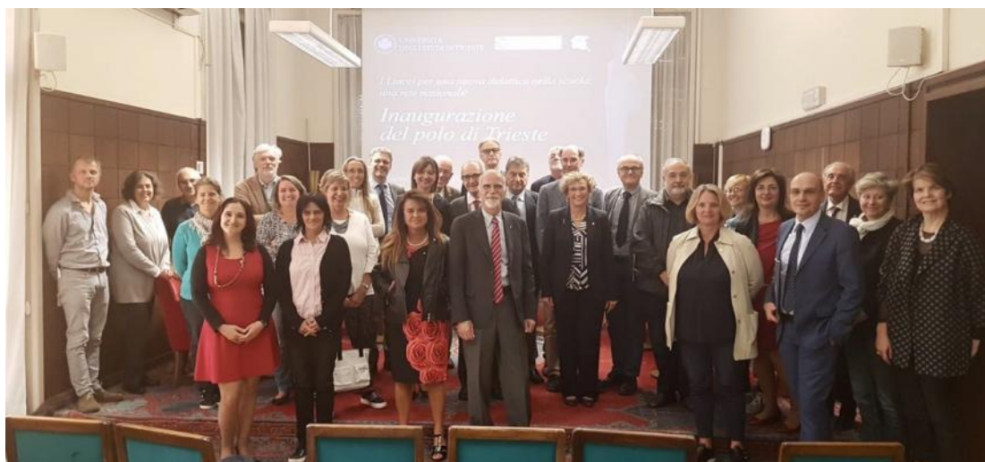
Figura 2. Avviato il Polo di Trieste dell’Accademia Nazionale dei Lincei (08 Ottobre 2018).

I corsi sono svolti con metodo laboratoriale, al fine di incoraggiare un atteggiamento attivo dei partecipanti e di promuovere tale metodo di insegnamento nelle Scuole.